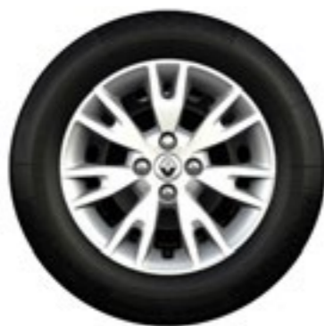
Calotas Eptius 15"