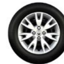
rodas Flex Wheel Oasis 16"